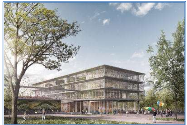
Siegerentwurf des hochbaulichen Wettbewerbs von Büro Hascher Jehle Design GmbH, Berlin, gemeinsam mit Gänßle + Hehr Landschaftsarchitekten PartGmbH, Esslingen am Neckar

Das Amt für Schulen plant derzeit, die Schulform der künftigen Grundschule als offene Ganztagschule zu organisieren. Ein entsprechendes Raumprogramm wurde auf Grundlage anderer, vergleichbarer Schulbauprojekte entwickelt, mit den Schulaufsichten abgestimmt und ist Planungsgrundlage für die Immobilienwirtschaft. Die planerische Umsetzung des gesamten Raumprogramms erfolgte in einem Wettbewerbsverfahren. Die neue Schule soll auch für öffentliche Nutzungen zur Verfügung stehen. Hier geht es aktuell um die Einrichtung einer Kunstschule und eines Cafés im Erdgeschoss, die zur Belebung des Standortes beitragen sollen. Eine Fertigstellung der Schule wird für 2025 erwartet (Drs. 0248/2021).