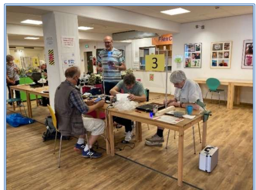
Reparatur-Café Gaarden unter Coronabedingungen in 2021

Die Unterstützung der Eigeninitiative durch Beratung, Vernetzung und insbesondere durch das Förderinstrument des Verfügungsfonds Gaarden ist ein wichtiger und nachgefragter Aufgabenbereich. Im Jahr 2021 wurden 15 Projekte mit Mitteln des Verfügungsfonds für Jung und Alt durchgeführt. Das Reparatur-Café Gaarden hat seit 2014 insgesamt 22 Mal mit über 1.500 Besucher*innen sowie über 1.000 Reparaturen stattgefunden. Nach dem Ausfall im Jahr 2020 konnte es 2021 wieder zweimal mit großer Resonanz