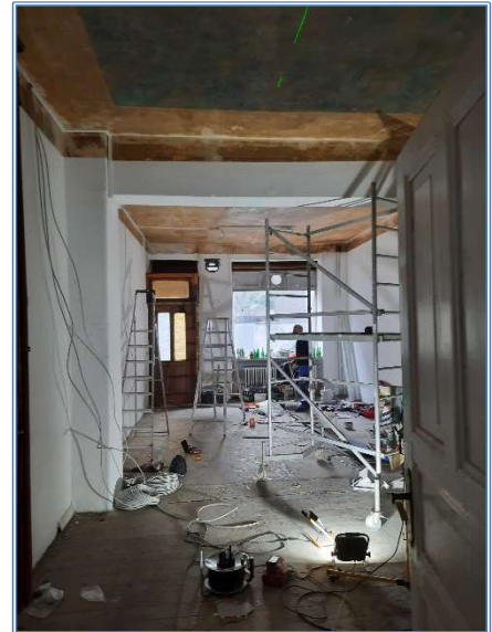
Sanierungsarbeiten im Rahmen der Schaffung von Ateliers im Kirchenweg

Die zum 1.10.2020 neu angemieteten Räumlichkeiten an der Elisabethstraße 102/ Ecke Kirchenweg inclusive der Hinterhofgebäude stellen dabei ein großes Potenzial für diesen Bereich dar. Die Sanierung ist in vollem Gange: die größere Gewerbeeinheit mit 147 qm konnte nach Komplettsanierung Mitte 2021 bezogen werden und wird zurzeit durch fünf Künstler*innen genutzt. Die angrenzende zweite Gewerbeeinheit, eine kleine Kneipe mit ca. 45 qm, wird zurzeit aufwendig saniert. Hier wurde mehr Zeit benötigt als ursprünglich vorgesehen, weil der ehemalige Mieter die Räume verspätet freigab. In den Räumen werden sich zwei Kreativschaffende einrichten, unter anderem mit einem Fotoatelier. Das angrenzende 2-stöckige Hinterhaus konnte dank zusätzlicher Mittel aus dem Fördertopf „Kiel hilft Kiel“ bereits sehr weit vorangebracht werden. Hier wird es zwei weitere Ateliers und einen Veranstaltungsraum geben. Die Umbauarbeiten werden zu größtenteils durch die Mieter*innen durchgeführt, die sich in einem Verein zusammengefunden haben. Nur durch diese Eigenleistungen ist das Vorhaben zur Umnutzung zweier Kneipen und zur Reaktivierung eines Hinterhofgebäudes möglich geworden.