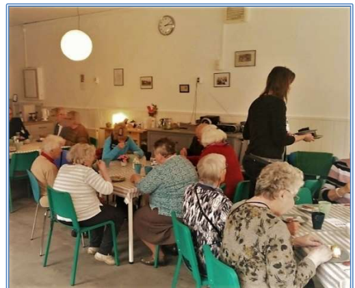
Besucher*innen im Nachbarschaftstreff in der Norddeutschen Straße

Seit Eröffnung wird der Nachbarschaftstreff, soweit es die coronabedingten Erlasse des Landes Schleswig- Holstein und die Infektionslage zulassen, täglich vormittags (10-12 Uhr) sowie dreimal wöchentlich nachmittags (14-18 Uhr) mit wechselnden Angeboten betrieben. Der Pandemieplan und die Hygienevorschriften der Stadtteilgenossenschaft Gaarden eG sind hier bindend und werden durch die Ehrenamtlichen umgesetzt. Während der Öffnungszeiten sind immer mindestens zwei der aktuell sieben Ehrenamtlichen vor Ort, die die Angebote mit den Besucher*innen durchführen. Die