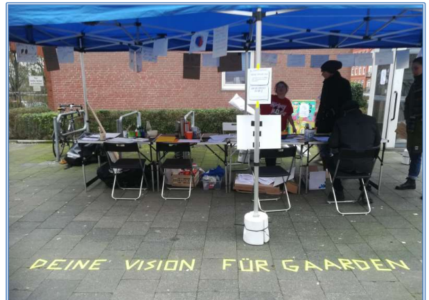
Beteiligung auf der Straße: Cultural Planning

Gaardener Bevölkerung in Form von Aktionswochen und Aktionstagen aufgegriffen. Gemeinsam mit Gaardener Bewohner*innen, Akteur*innen und Künstler*innen konnten Ideen zu den Themen „Mehr Grün & Mehr Blumen“, „Mehr Respekt, Mehr Sicherheit“ und „Mehr Miteinander“ entwickelt und umgesetzt werden. Die Aktionen wurden filmisch dokumentiert und sind auf dem Youtube-Kanal des Büros für Stadtteilentwicklung einsehbar. Darüber hinaus wurde eine Dokumentation über den gesamten Prozess in Form von drei Broschüren mit den Titeln „wahrnehmen“, „träumen“ und „machen“ erstellt, die sowohl digital als auch gedruckt verfügbar sind. Durch den partizipativen Ansatz wurden Gaardener Bewohner*innen unterschiedlicher Hintergründe aktiviert, sich künstlerisch-kreativ mit ihrem Wohnumfeld auseinanderzusetzen. Zudem ermöglichten die künstlerischen Elemente bei den Teilnehmenden die Entwicklung neuer Perspektiven auf den Stadtteil.