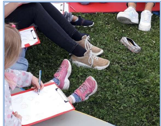
„Wort und Bild“ ein literarisches Mitmachvariété in Gaarden im Rahmen des Kieler Kultursommers 2021, gefördert von NEUSTART KULTUR Kulturstiftung des Bundes und der Landeshauptstadt Kiel.

Auf Beschluss der Ratsversammlung (Drs. 1137/2018) wurden ab 2019 für Kunst im öffentlichen Raum als „temporäre kulturelle Intervention in einem sozial benachteiligten Stadtteil“ 50.000,- Euro in den