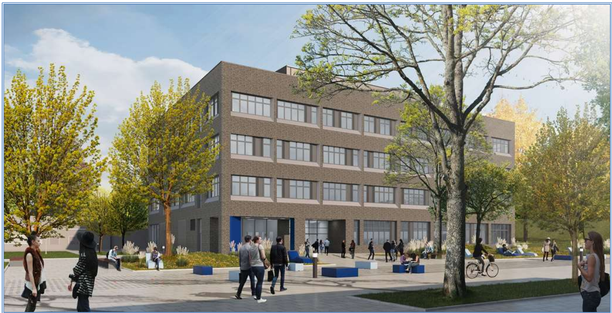
Visualisierung der Eingangssituation zur Technischen Fakultät von der Ecke Elisabethstraße/ Norddeutsche Straße

HSG: DE-292-BVH ZEVS+HSG Kiel Cam-1 - baustelle.strabag.com