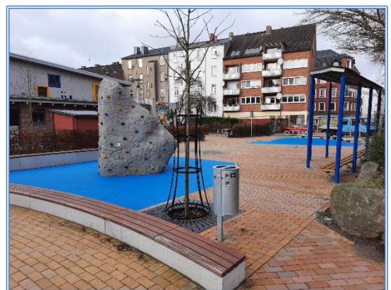
Neu gestaltete Fläche in der Georg-Pfingsten-Straße

Die seit Herbst 2020 andauernden Umgestaltungsarbeiten im Bereich Georg-Pfingsten-Straße / Kaiserstraße wurden im Jahr 2021 abgeschlossen. Mit Mitteln aus dem Städtebauförderungsprogramm „Sozialer Zusammenhalt“ ist als Herzstück ein verkehrsberuhigter Quartiersplatz entstanden. Er verbindet die beiden gegenüberliegenden Kindertagesstätten des Familienzentrums Gaarden, die von über 300 Kindern besucht werden. Es entstand eine neue Begegnungs- und Aufenthaltsfläche mit Spielelementen auch für die Bewohnenden, die die Attraktivität des Quartiers erhöht. Zudem wurde im Zuge der Umgestaltung der obere Abschnitt der Kaiserstraße aufgewertet, der Parkraum neu sortiert und ein Wendehammer am Endstück der Kaiserstraße errichtet. Die Georg-Pfingsten-Straße ist nun für den Autoverkehr gesperrt.