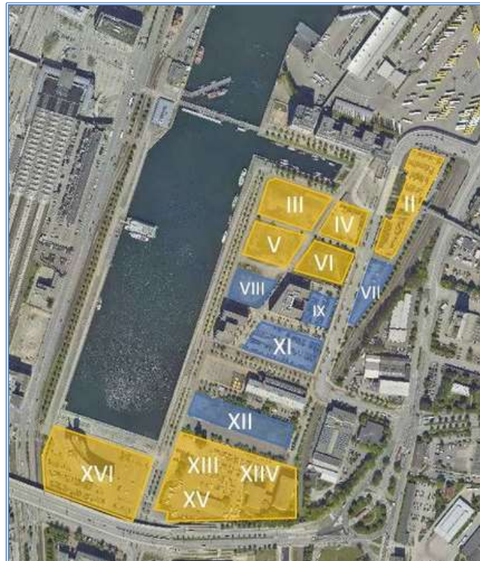
Baufelder an der Kieler Hörn

Die Hörn wird umfangreich bebaut. Viele Vorhaben sind in der Planung und in der Realisierung. Folgende Projekte sind derzeit projektiert: