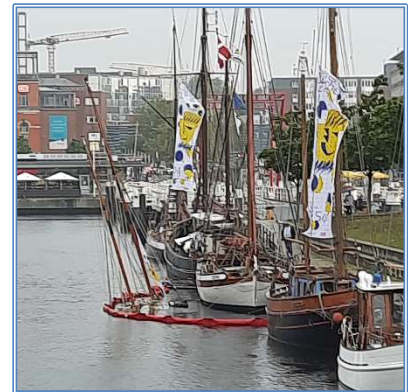
Nach Einbruch gesunkenes Traditionsschiff im Germaniahafen

Ende 2021 sind Planungen aufgenommen worden, diesen Bereich auszuleuchten und in Szene zu setzen. klimagaarden hat in Zusammenarbeit mit Lichtplaner*innen einen ersten Entwurf erstellt. Die Realisierung ist zurzeit noch offen.