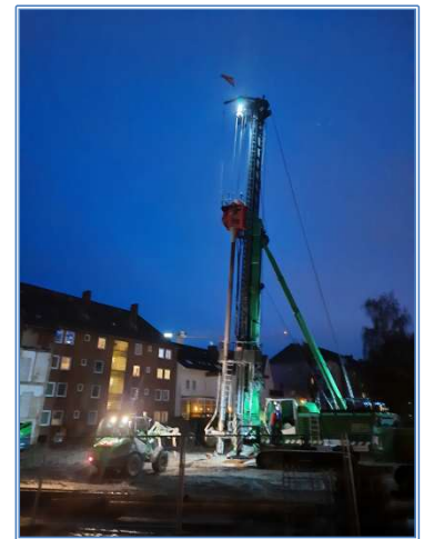
Bauarbeiten in der Hügelstraße 3

Weitere Bauvorhaben, die begonnen wurden oder kurz vor Beginn stehen, sind: