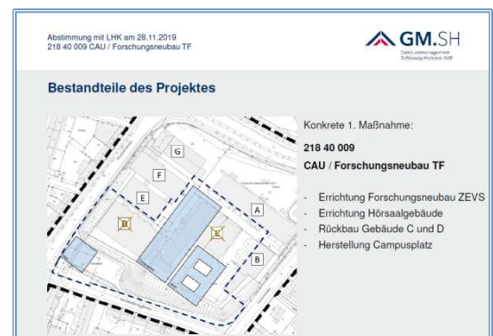
Neubauplanung Technische Fakultät

Mitte 2021 wurde das erste große Bauvorhaben an der Technischen Fakultät der Christian-Albrechts-Universität zu Kiel (CAU) in Gaarden begonnen. Das Innovationszentrum für Forschung und Technologietransfer soll nach Fertigstellung im Jahr 2023 das interdisziplinäre Zentrum für vernetzte Sensorsysteme (ZEVS) beherbergen. Das neue Hörsaalgebäude (HSG) an der Ecke Elisabethstraße und Norddeutsche Straße wird neben Hörsälen und Seminarräumen auch eine Fachbibliothek und ein Café enthalten. Es bildet den neuen Eingang zum Campus Gaarden und ist ein wichtiger Baustein zur Vernetzung der Fakultät mit dem Stadtteil. Bis Ende 2024 erfolgt die Ausgestaltung eines neuen Campusplatzes. Die Fakultät soll sich stärker als bisher in das Umfeld öffnen. Studierende sollen die Möglichkeiten und